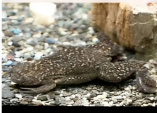
RANA DE UÑAS AFRICANA